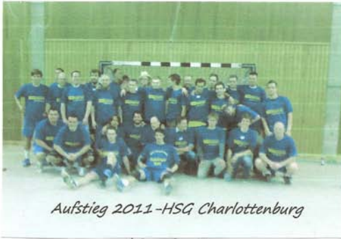
Aufstieg 2011-HSG Charlottenburg

Die männliche E.- + D.- Jugend gratuliert unser 1 + 2 Männermannschaft zu Aufstieg !!